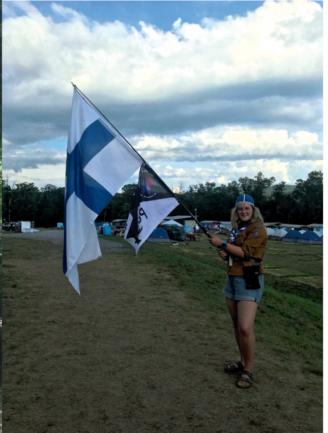
teksti: Kupa