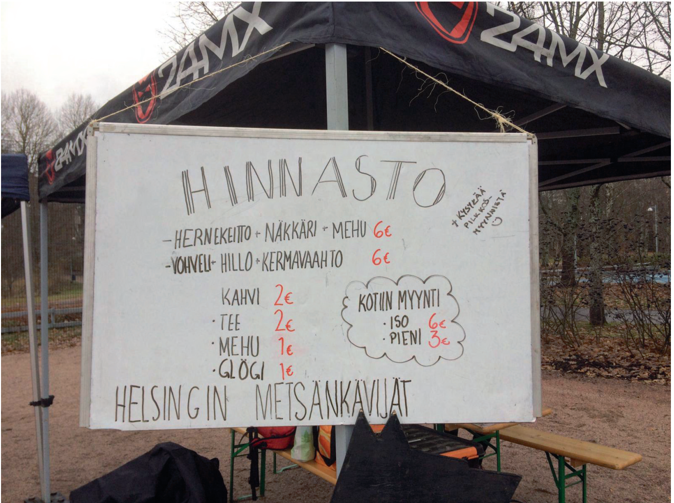
HeMen ravintolapäivä 9.11.2019