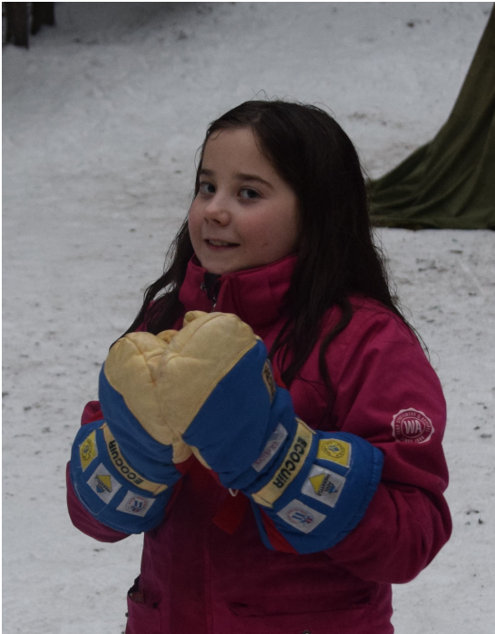
Kirppu vuonna 2017